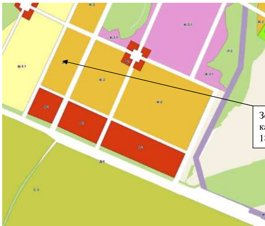
Рис.2. Выкопировка из ПЗЗ г.Воткинска.

Земельный участок с кадастровым номером 18:27:070002:515