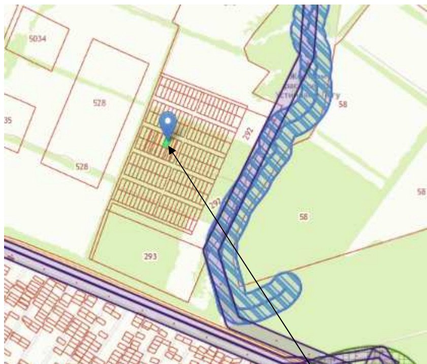
Рис.3. Выкопировка из публично – кадастровой карты земельных участков города Воткинска

Земельный участок с кадастровым номером 18:27:070002:515